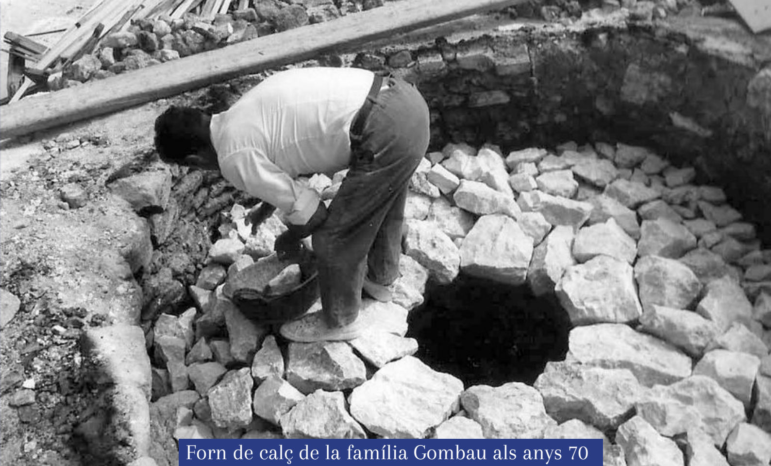
Forn de calç de la família Gombau als anys 70