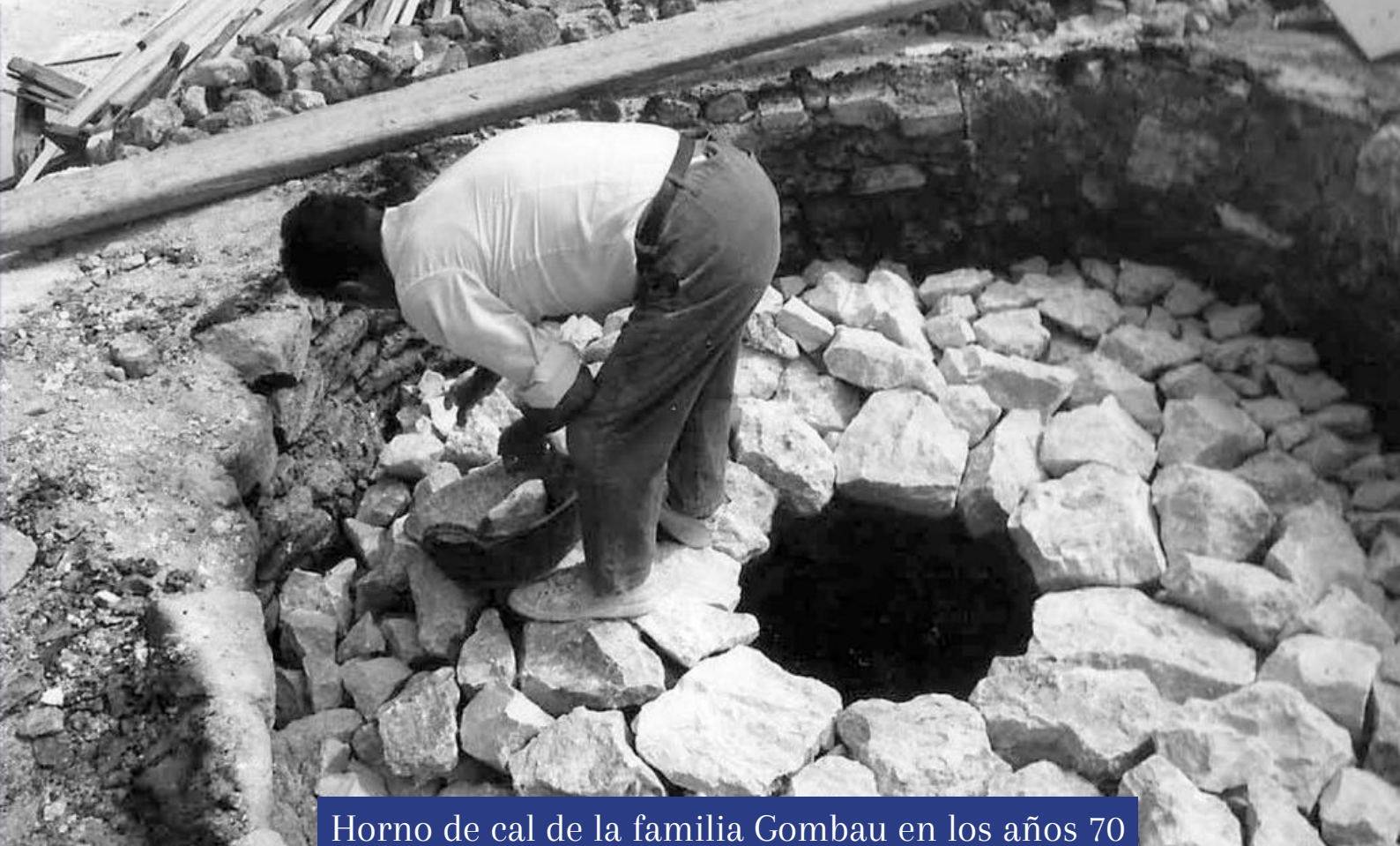
Horno de cal de la familia Gombau en los años 70